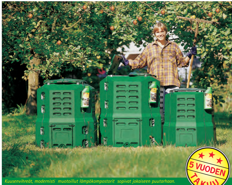
Kuusenvihreät, modernisti muotoillut lämpökompostorit sopivat jokaiseen puutarhaan.