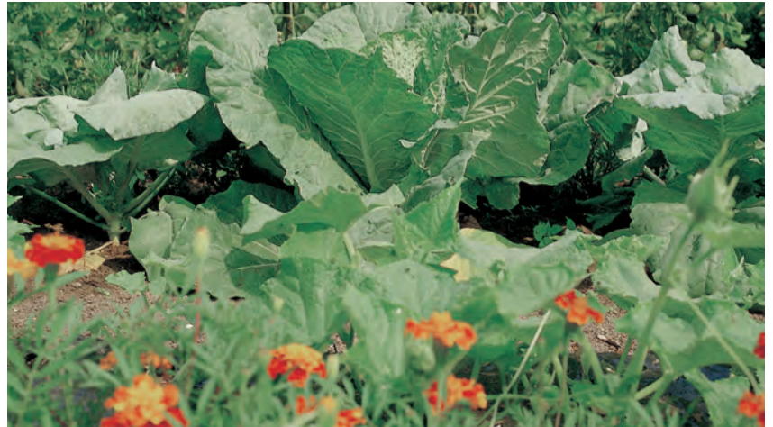
Palkinto säännöllisestä tuorekompostin käytöstä on rehevä puutarha.