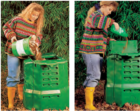
Kaada keittiöjätteet kompostoriin ja sirottele päälle Bio-Composter -hiutaleita.